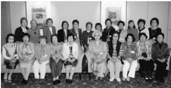
平成24年4月6日 泉尾高女23期生 於 帝国ホテル なた万

帝国ホテルの側の川の兩岸の桜が見事に開花し、美しい桜の花を眺めながら泉尾高女23期生の同窓会を「なだ万」で催しましたところ、23名の者が集いました。なつかしい人、一年ぶりの人等が、