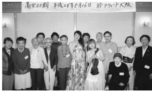
高女20期 平成24年5月16日 於 アウイーナ大阪

平成25年5月15日(水) 12時~16時 受付 11時 会場 アウイーナ大阪 06・6772・1441 写真撮影あり、時間厳守 高女20期