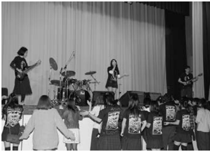
(文化祭での舞台発表)

部員数が多く、校内・校外ともに人前に立って発表する機会が多い部活動です。毎日の放課後の活動を中心に、ときには始業前や昼休みを使つての練習も行っています。文化祭後に3年生23名が引退し、現在は2年生8名、1年生4名の計12名で活動しています。校外では、大正区役所主催のT-1グランプリ、キャット