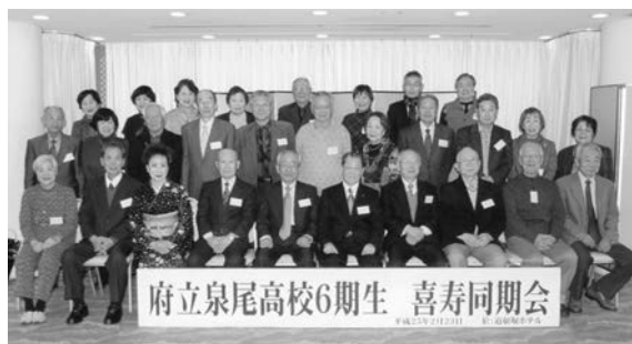
府立泉尾高校6期生 喜寿同期会

当初は、34名の出席返信があったが、直前になり4名が欠席。加齢とともに体調の変化があり、当日まで出欠が把握し難い年齢となった。しかし、「光輝好齢者」の自覚を持つての面々は、恒例の3分間スピーチで「学校時代の思い出」「近況報告」など各自で発言。トリは、同期の一人に