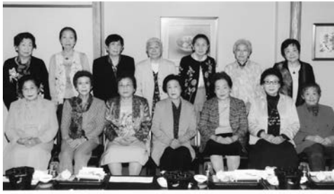
大阪府立泉尾高女 21期生 同期会 平成24年10月23日 於 大和屋本店