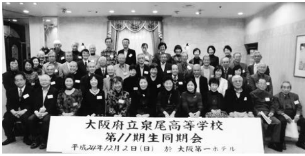
大阪府立泉尾高等学校 第11期生同期会 平成24年12月2日(日) 於 大阪第一ホテル

8月初め、各クラス選抜の幹事会をもち、9月初めに参加の連絡を約180名に発送し、当日は50人の同期生(男性29人、女性21人)が出席した。卒業以来初めて参加の人もいました。