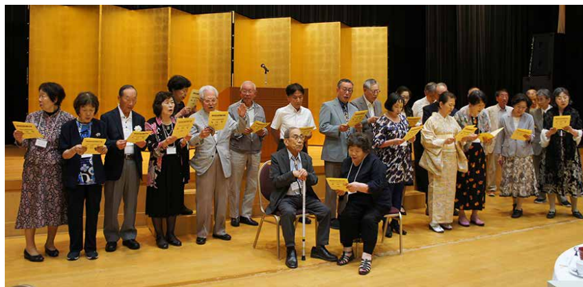
(上) 集合写真 (左) 校歌斉唱