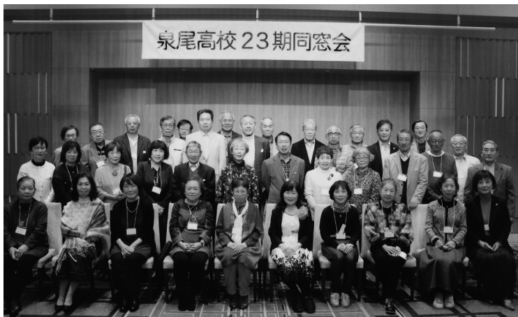
泉尾高校23期同窓会